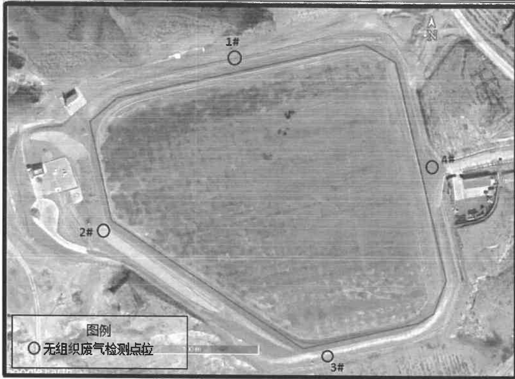
图 1 无组织废气检测点位示意图